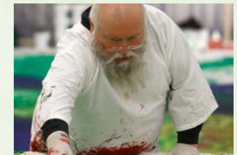
SINNE UND SEIN Retrospektive