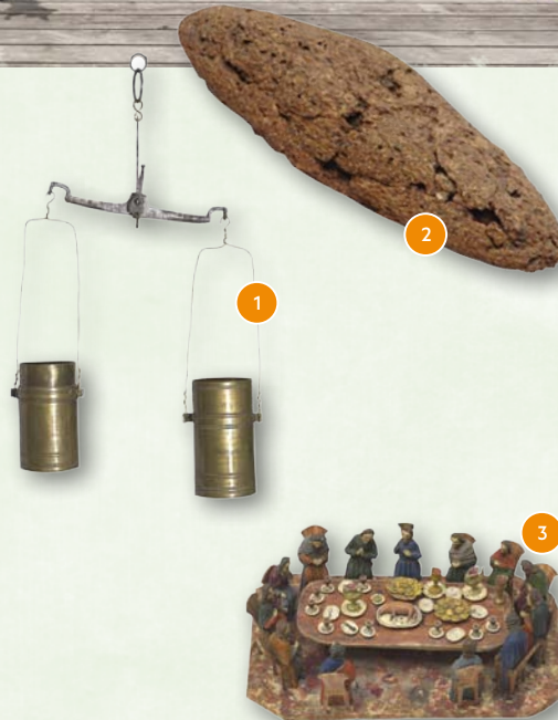
1 Getreidewaage, Wien, 19. Jh. 2 Brotlaib aus Ägypten, ca. 1000 v. Chr. 3 Holzschnitzfigurengruppe „Letztes Abendmahl“, Südtirol, 19. Jh.

Auch die Region um Asparn an der Zaya ist eine Entdeckungsreise wert.