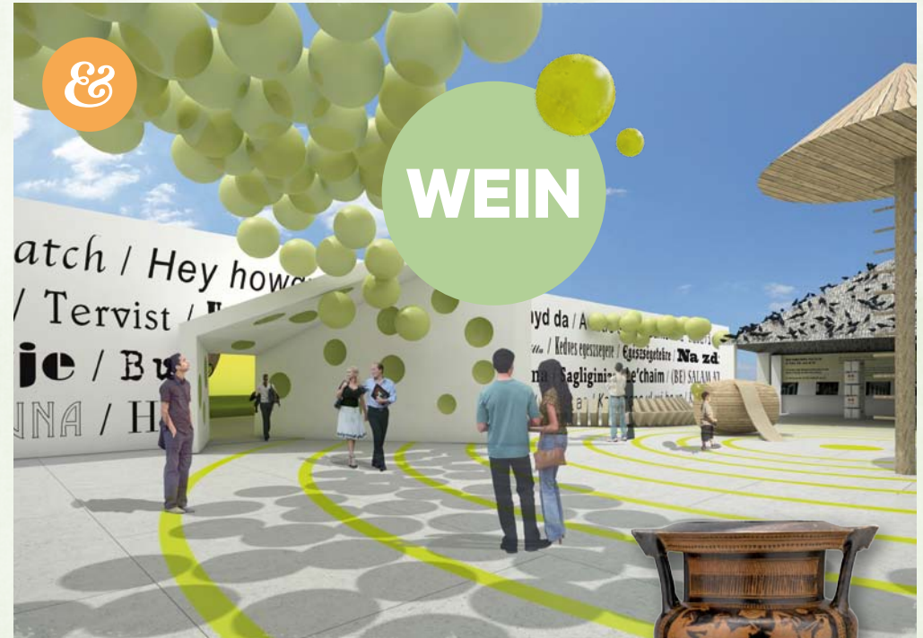
BILDER: Christof Cremer (Ehntwurf) / Tobias Colz (Visualisierung), Bild 1, Bild 3: Österreichisches Museum für Volkskunde, Wien, Foro, Peter Kainz; Bild 2: Kunsthistorisches Museum Wien, Ägyptisch-Orientalische Sammlung